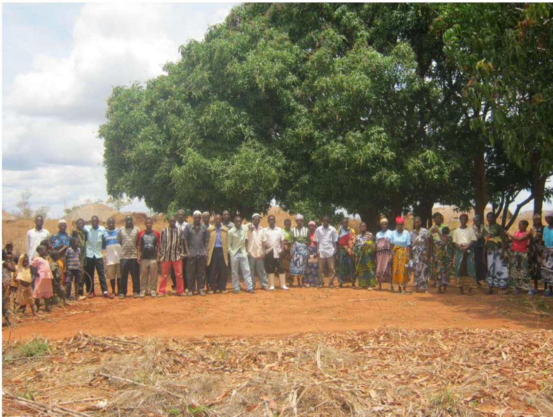
Nota: 2011ko azaroan diru kreditua jasotzen Namarrenkako herrixkan (Marrupa).

Urte hauetan landutako beste gai bat emakumeen parte hartzearena izan zen. Horrela 2003-2004 sasoian emakumeek kreditu guztiaren %2a bakarrik jaso bazuten, 2012-2013 sasoian kreditu guztiaren %54a jaso dute. Prozesu hau pixkanaka egin da, pazientziaz baina etenik gabe.